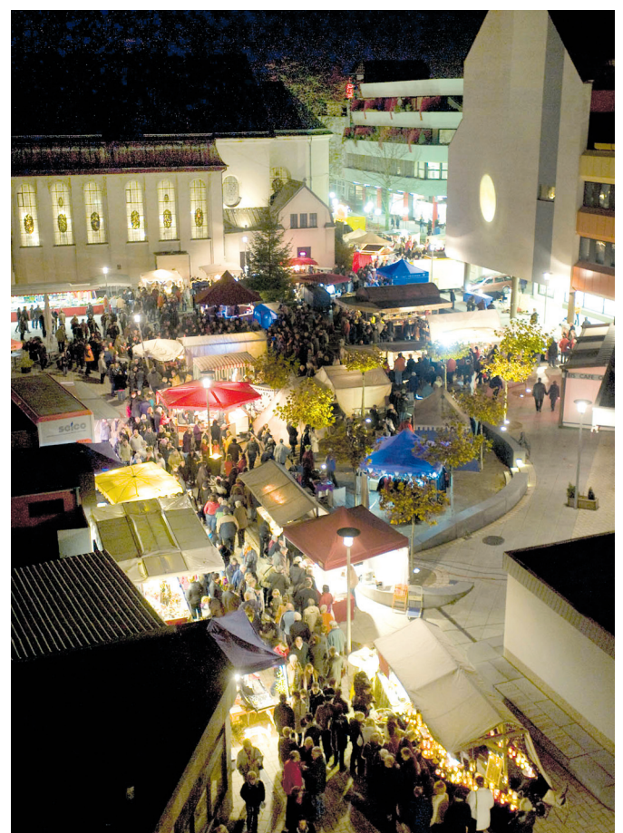
Im romantisch-herbstlichen Ambiente präsentiert sich der Völklinger Mondscheinmarkt.

Der Eintritt zum Mondscheinmarkt in Völklingen ist frei. Weitere Informationen zum Markt erteilt die Tourist-Information der Stadt Völklingen unter der Telefonnummer (06898) 13-2800 oder im Internet unter www.voelklingen.de .