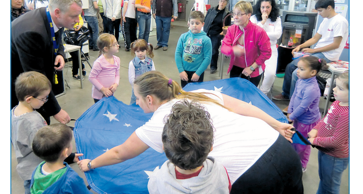
Bei Bewegungsspielen mit dabei: Bildungsminister Ulrich Commerçon (links).

Interessierte können sich schon mal den 17. November vormerken. An diesem Samstag findet nämlich von 10 bis 14 Uhr der 6. Gesundheitstag im Globus Baumarkt in der Zechenstraße 8 statt. Thema ist diesmal Alkohol und Sucht.